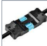
GST - Wieland snoeren Op aanvraag