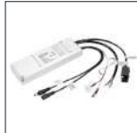
Noodmodule Kit 1000282