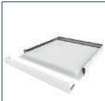
Opbouwset Wit 60x30:1000954 60x60:4607764 120x30:4607771